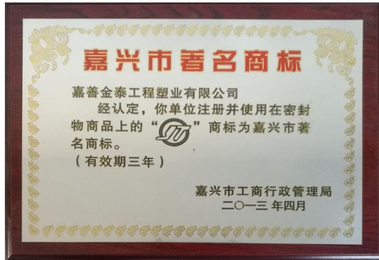
图 2 嘉兴市著名商标